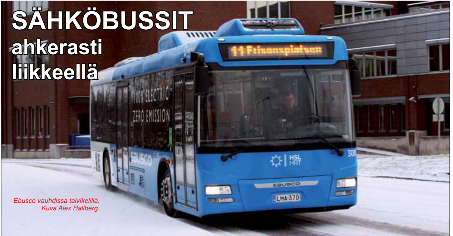
Ebusco vauhdissa talvikelillä.

e BUS-hankkeen testaukset ovat sujuneet hyvin. Veolialla on säännöllisessä vuoroliikenteessä kolme sähköbussia, joiden toiminta on päivä päivältä tuottavampaa, kertoo Espoon korjaamopäällikkö Lasse Tiikkaja .