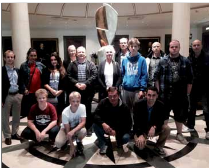
Amerikkalaiset vieraat ja Veolialta KutsuPlus -palvelun testeihin osallistuneet yhteiskuvassa.